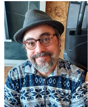
PACO: Duke Ellington