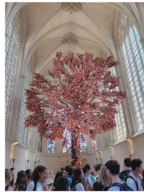
Sainte Chapelle Castillo de Vincennes

Esta colaboración entre institutos europeos ha sido facilitado por el convenio entre la Consejería de Educación de CLM y la Académie de Créteil en París. ANA LÓPEZ