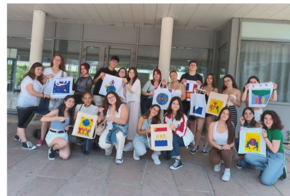
Actividades creativas sobre medioambiente