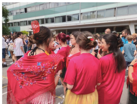
Patrimonio cultural Folkllore Carnaval Españoles y franceses con trajes típicos