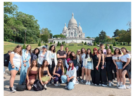
Descubriendo el patrimonio Europeo con el Lycée H. Berlioz