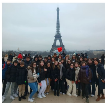
Paseando por la Tour Eiffel

Este viaje ha sido una gran oportunidad, tanto de conocer París, una ciudad de película, como de conectar o ampliar las relaciones con otras personas de nuestra edad. Respecto a las visitas, han sido impresionantes: la Torre Eiffel y el Arco del Triunfo no tienen comparación, sus vistas son espectaculares y su arquitectura aún más. La Sainte Chapelle es única, nunca había visto tantos colores ni vidrieras tan grandes como allí. La Catedral de Notre Dame sus vistas a la fachada principal son muy bonitas. Las creperías son algo muy típico de París que no te puedes perder. En el Louvre me podría pasar horas y horas entre sus cuadros y estatuas, todo es precioso, no te vas a arrepentir de quedarte horas admirando todos los detalles de sus obras. En la Basílica Sacré Coeur te sientes en una película, subir por sus escaleras escuchando la música, el ambiente y las vistas, es precioso. Aunque si tenemos que hablar de vistas, hablaríamos de las de la puerta de la basílica, no te vas a arrepentir de subir esas escaleras y admirar su belleza. El Barrio Rojo y el Moulin Rouge fueron curiosos e importantes en la ruta. Y como última actividad en la capital, al anochecer un paseo por el Sena de película. Disney fue genial, es precioso, pero sin duda no lo habría sido tanto si no hubiéramos estado todos juntos. Las nuevas experiencias y amistades creadas en este viaje serán inolvidables. Sin duda repetiríamos este impresionante y único viaje. LUCIA PAÑOS