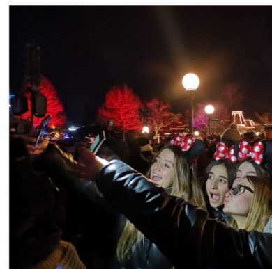
Un día en Euro Disney

Este viaje ha sido una gran oportunidad, tanto de conocer París, una ciudad de película, como de conectar o ampliar las relaciones con otras personas de nuestra edad. Respecto a las visitas, han sido impresionantes: la Torre Eiffel y el Arco del Triunfo no tienen comparación, sus vistas son espectaculares y su arquitectura aún más. La Sainte Chapelle es única, nunca había visto tantos colores ni vidrieras tan grandes como allí. La Catedral de Notre Dame sus vistas a la fachada principal son muy bonitas. Las creperías son algo muy típico de París que no te puedes perder. En el Louvre me podría pasar horas y horas entre sus cuadros y estatuas, todo es precioso, no te vas a arrepentir de quedarte horas admirando todos los detalles de sus obras. En la Basílica Sacré Coeur te sientes en una película, subir por sus escaleras escuchando la música, el ambiente y las vistas, es precioso. Aunque si tenemos que hablar de vistas, hablaríamos de las de la puerta de la basílica, no te vas a arrepentir de subir esas escaleras y admirar su belleza. El Barrio Rojo y el Moulin Rouge fueron curiosos e importantes en la ruta. Y como última actividad en la capital, al anochecer un paseo por el Sena de película. Disney fue genial, es precioso, pero sin duda no lo habría sido tanto si no hubiéramos estado todos juntos. Las nuevas experiencias y amistades creadas en este viaje serán inolvidables. Sin duda repetiríamos este impresionante y único viaje. LUCIA PAÑOS