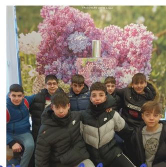
Museo del perfume