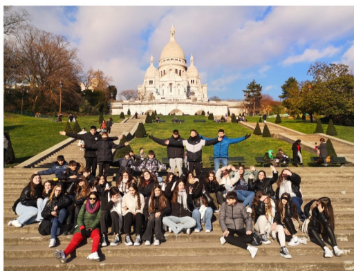
Sacré-coeur y Montmartre