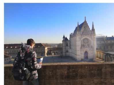
Château de Vincennes