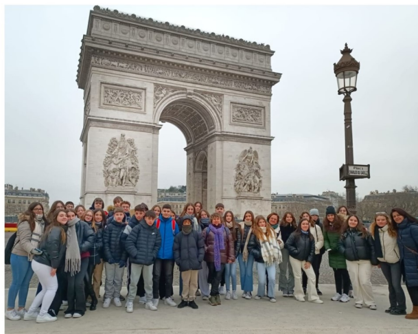
Visita al Arco del Triunfo