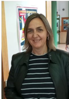
LINA: Manolito Gafotas , de Elvira Lindo.