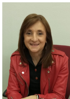
PILAR: Los libros de El presente eterno , de S. Giedion y Materiales y técnicas del arte de R. Mayer.