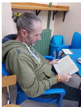
JUAN RAMÓN: El lobo de Wall Street , de Jordan Belfort.