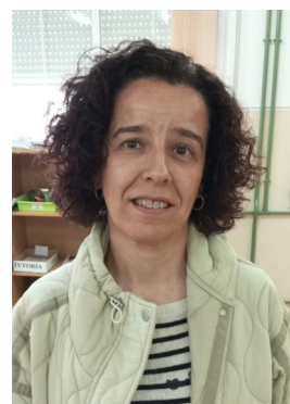
MARIBEL: El tío Petros y la conjetura de Godbach , de A. Doxiadis.