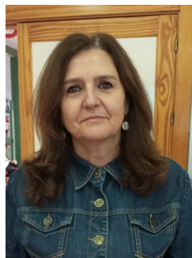
LLANOS: Mi familia y otros animales de G. Durrel.