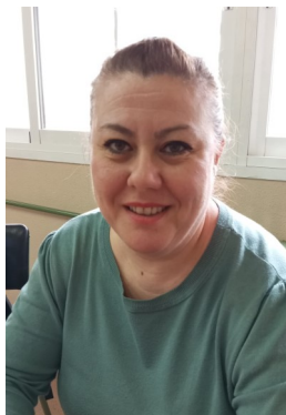
JULIA: la trilogía Century de Ken Follet.