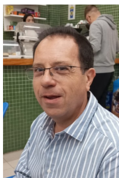
PEDRO: Genio, tecnología y digitalización , de J. Moreno Vázquez.