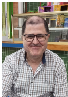
JESÚS: Fundamentos y problemas de Química , de F. Vinagre.