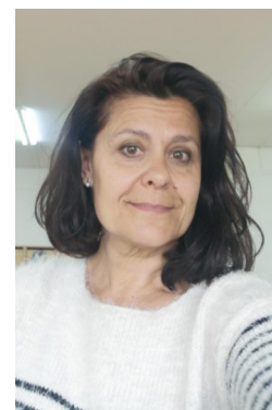
ANA: Le petit prince de Saint Exupéry.