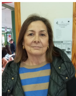
CHARO: El alquimista , de Paulo Coelho.