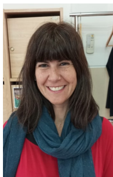
MARÍA: El infinito en un junco , de Irene Vallejo.