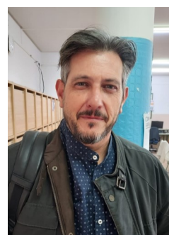
MUNDI: El lado humano de las empresas , de McGregor.