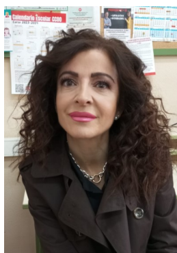
ASCEN: Cómo ser un artista , de J. Saltz.