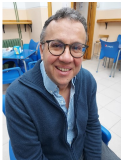
PACO: The curious incident of the dog in the night-time , de Mark Haddon.

En este número de MÁS CHULO QUE EL 8, dedicado especialmente a los libros, hemos querido preguntar a algunos profesores ¿qué libro relacionado con tu asignatura recomendarías? ¿Qué crees que podría leer alguien que empezara a sentirse atraído por una determinada materia? Aquí van muchos libros interesantísimos.